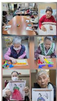
3층 어르신 다양한 프로그램 활동