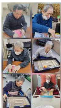
5층 어르신 다양한 프로그램 활동