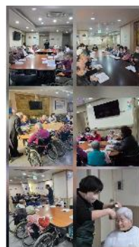
예배 및 미용봉사 활동