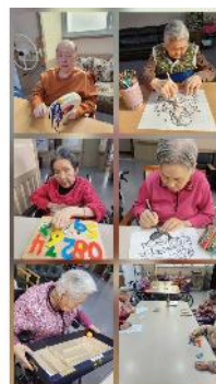
4층 어르신 다양한 프로그램 활동