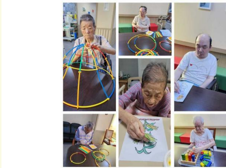
5층 어르신 다양한 활동