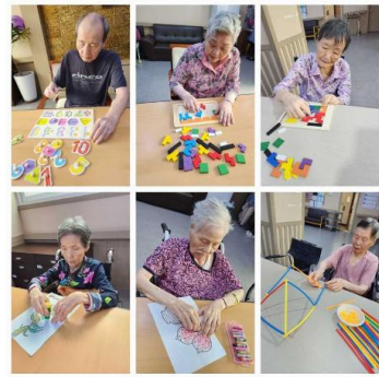
4층 어르신 다양한 활동