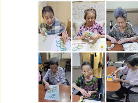
3층 어르신 다양한 활동