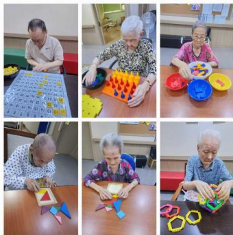
블록, 칠교, 수학활동