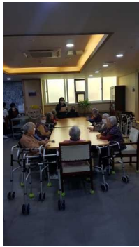
4층 어르신 인권교육